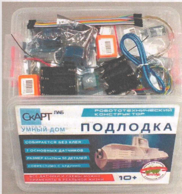
Умный дом «Подлодка»

странства жилого дома на отдельные зоны с дальнейшей разработкой оптимизации ресурсов семьи. Так, например, анимационная графическая работа обучающихся демонстрирует, что в детской комнате можно разместить датчики движения для регулирования системы освещения, датчики, позволяющие управлять поднятие и опускание жалюзи на окнах с помощью смартфона, а также управлением аудио- и видеосистемой дома.